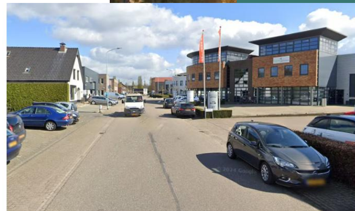
▲ Bedrijventerrein Hoge Eng in Putten.