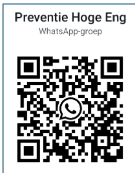
uitnodiging Whatsapp-groep Preventie.